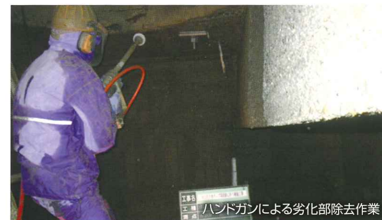
ハンドガンによる劣化部除去作業