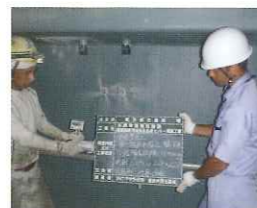
各省市・お客様立ち合いのもとでの立会検査業務