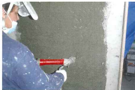
断面修復・モルタル吹き付け工法

除去した箇所の断面修復を行い、各所環境や目的に合わせた最適な工法で補修・防水・防食・重防食・剥落防止工事を行います。