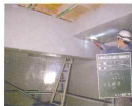
塗膜面のピンホールの有無を検査