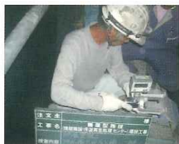
完了後の付着力試験

調査から完了まで、一括責任施工をモットーとする当社では、施工完了後の検査業務も承っております。