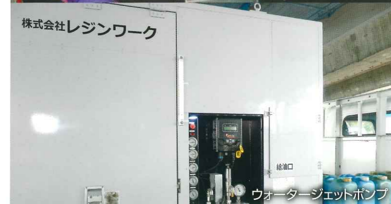
ウォータージェットポンプ

ウォータージェット工法は水のみを使用するので、粉塵の発生が無く、クリーンでエコな工法です。