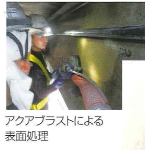
アークアブラストによる表面処理