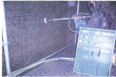
ウォータージェットによる劣化部除去

構造物の劣化診断に基づいて、劣化程度に合わせた工法を選定し、適切な劣化部除去作業を行います。