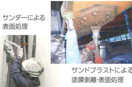
サンドブラストによる塗膜剥離・表面処理