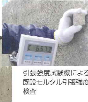
引張強度試験機による既設モルタル引張強度検査