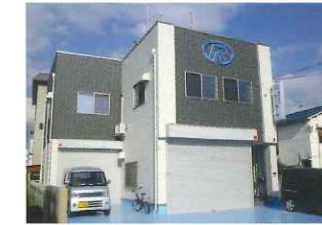
■大阪本社 〒561-0836 豊中市庄内宝町2丁目9番37号 TEL.06-6332-6559・FAX.06-6332-6564