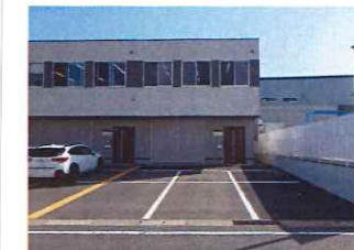
■九州営業所 〒800-0255 福岡県北九州市小倉南区上葛原2-22-25 TEL.093-967-1401・FAX.093-967-1402