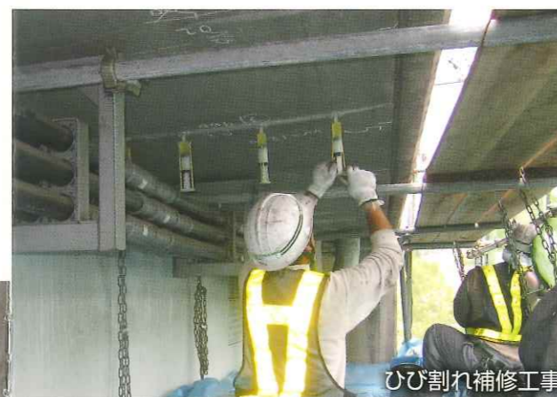
ひび割れ補修工事

サンドブラストによる旧塗膜剥離・下地処理から塗料吹き付け、ローラー、刷毛塗りによる仕上げ塗装まで、一貫した施工を提供します。