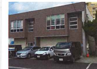
■東京支店 〒124-0023 東京都葛飾区東新小岩2-22-1A棟102 TEL.03-5654-6216・FAX.03-5654-6217