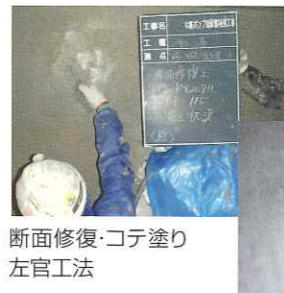
断面修復・コテ塗り左官工法