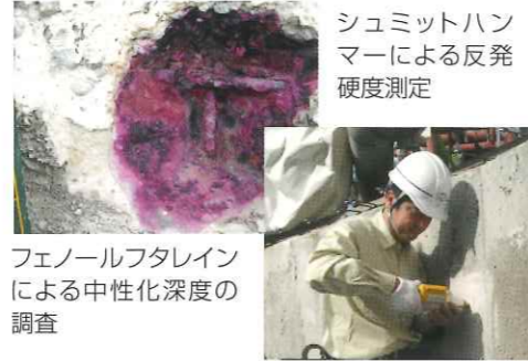
シュミットハンマーによる反発硬度測定